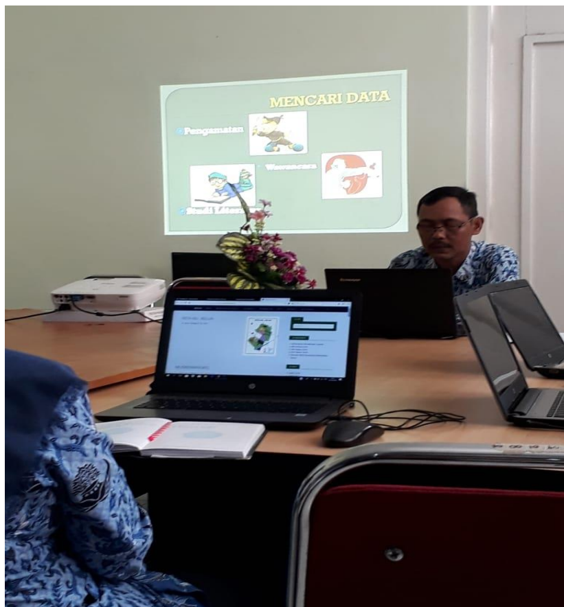
Pelatihan admin website PPID Pembantu (Pengisian website dan Jurnalistik)