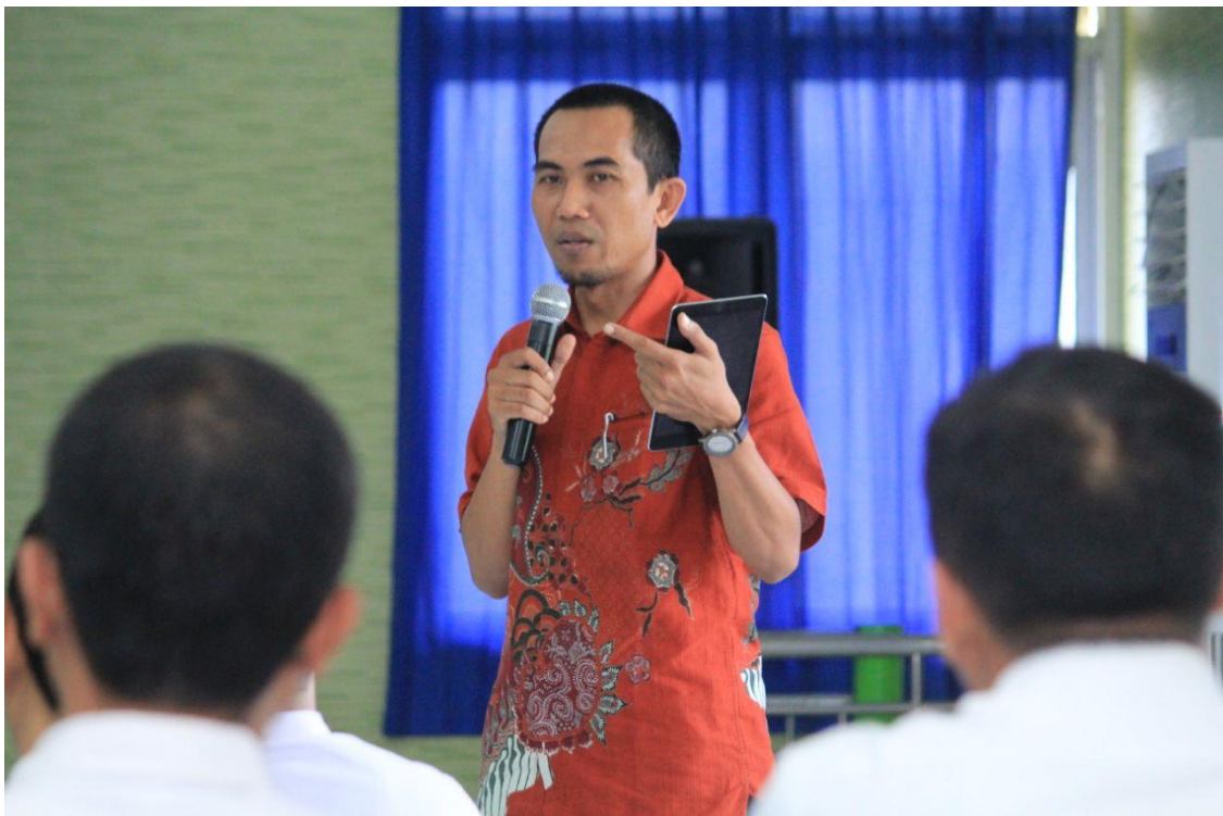
Pembinaan Admin Website PPID Pembantu OPD dan Kelurahan dalam Rangka Optimalisasi PPID Kota Madiun Tahun 2018