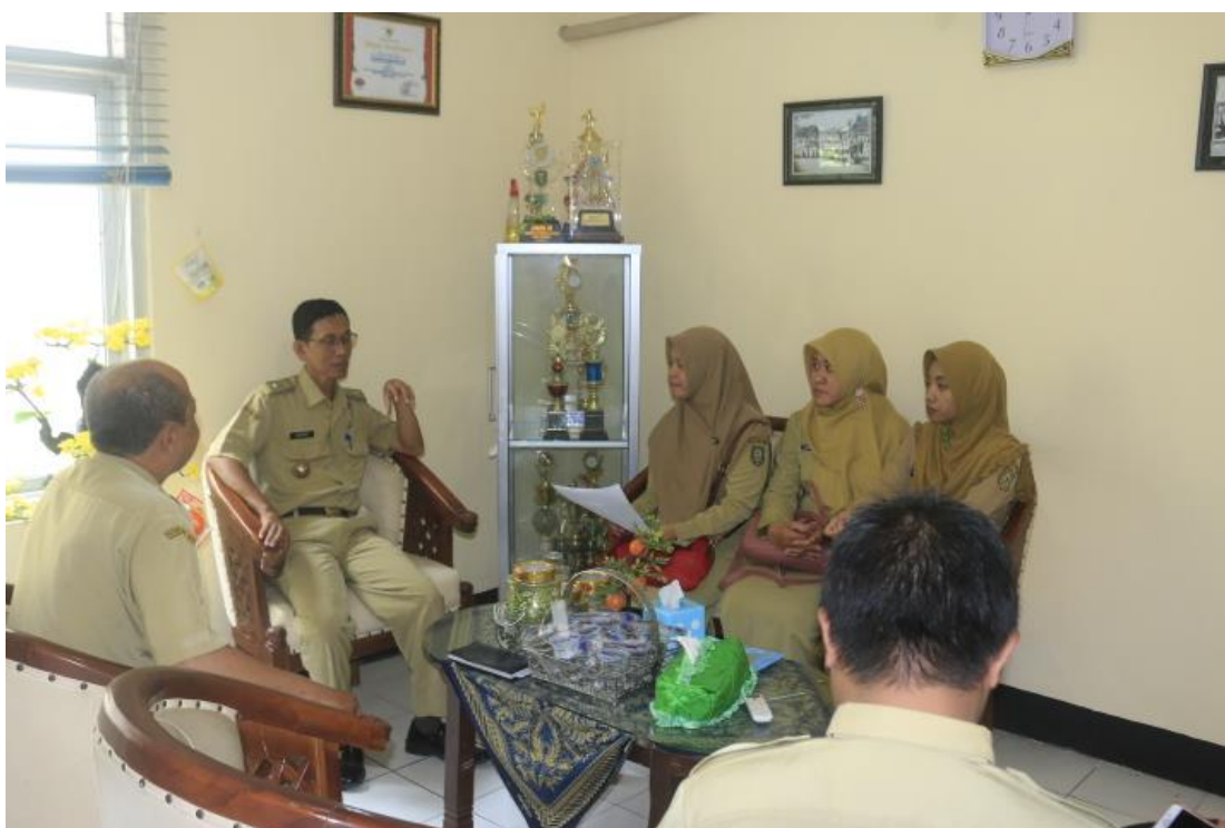
Monitoring dan Evaluasi PPID Utama Kota Madiun ke PPID Pembantu Kota Madiun Semester II Tahun 2018