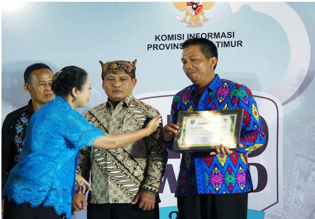
Penghargaan dari KIP Provinsi Jatim kepada PPID Kota Madiun dan PPID Pembantu Kelurahan Pangongangan Kota Madiun dalam Acara PPID Award Tingkat Provinsi Jawa Timur Tahun 2018