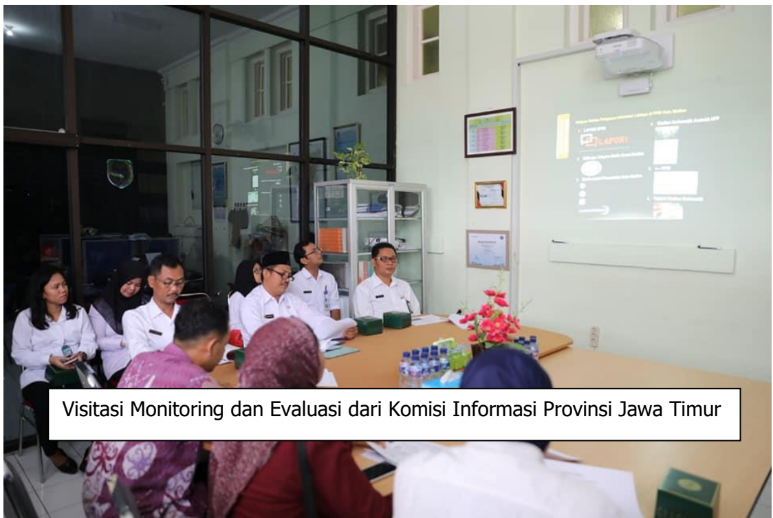
Visitasi Monitoring dan Evaluasi dari Komisi Informasi Provinsi Jawa Timur