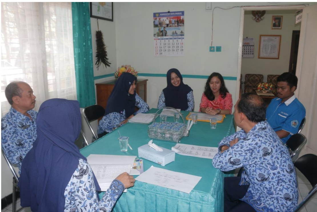
Monitoring dan Evaluasi PPID Utama Kota Madiun ke PPID Pembantu Kota Madiun Semester I Tahun 2018