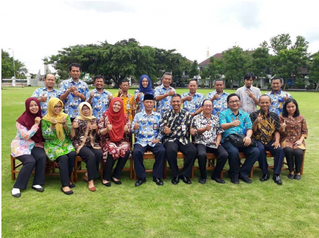
Studi Tiru PPID Kota Madiun ke PPID Kabupaten Pacitan