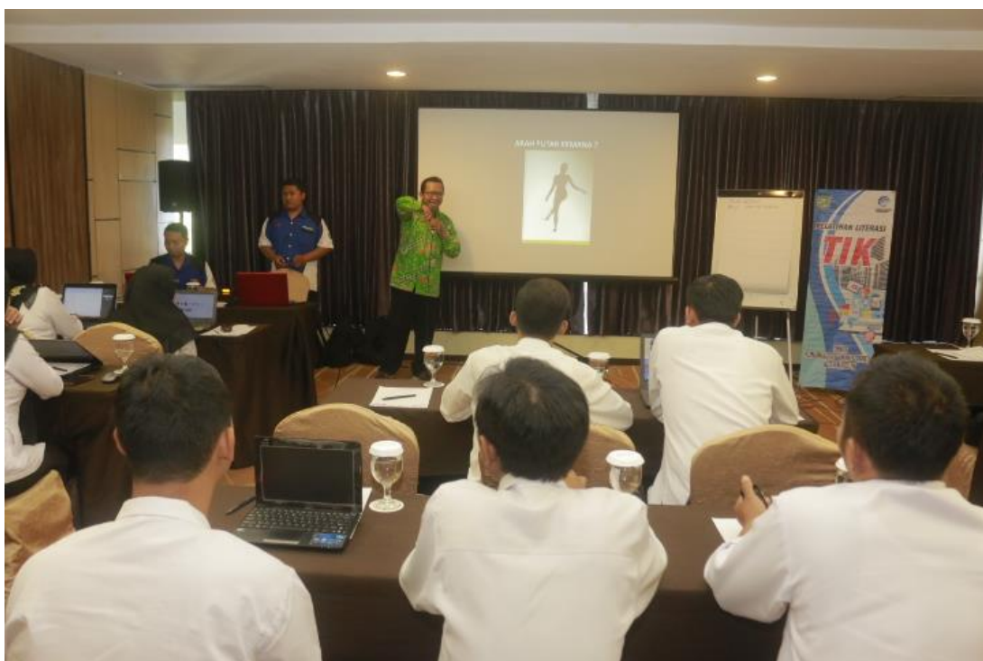
Pelatihan Teknologi Informasi dan Komunikasi Bagi Admin PPID Utama/Pembantu se Kota Madiun