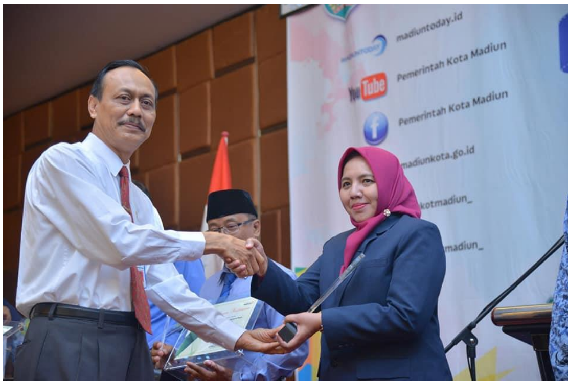
Evaluasi Pengelolaan Layanan Informasi dan Dokumentasi Publik di Lingkungan Pemerintah Kota Madiun dan PPID Award Tingkat Kota Madiun Tahun 2018